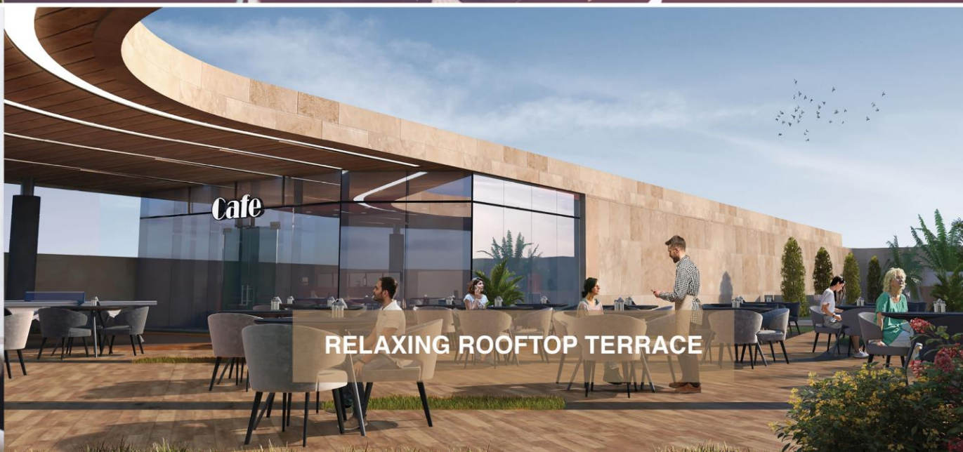
RELAXING ROOFTOP TERRACE