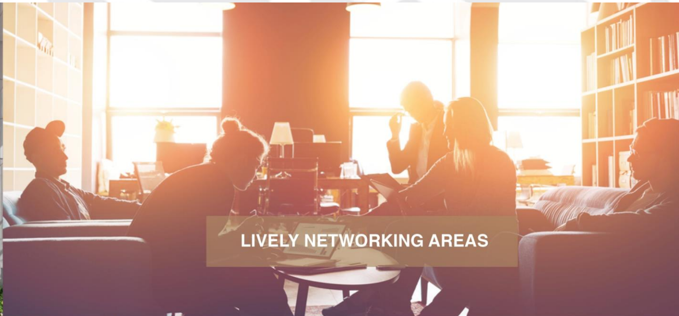
LIVELY NETWORKING AREAS